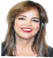
Dip. Lorena Villavicencio Ayala